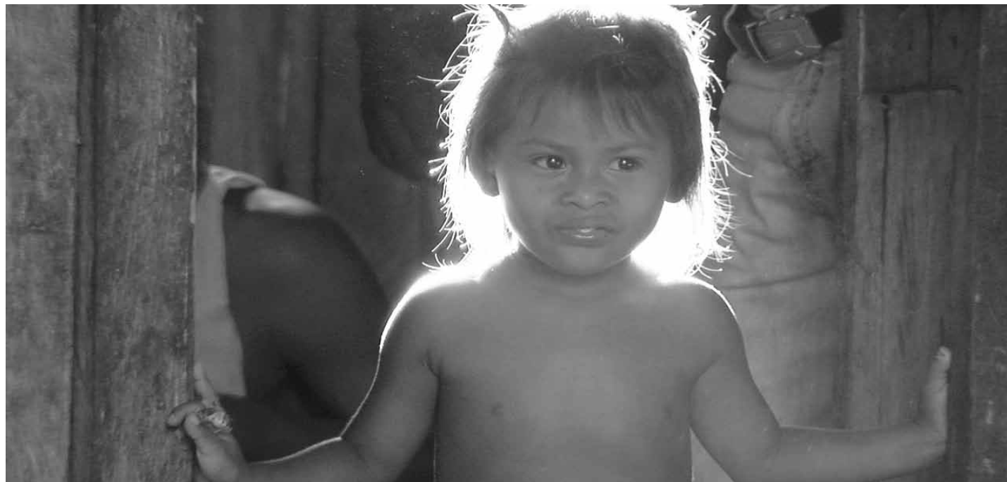
Dentro de la selva: fotograma de Yasuní dos segundos de vida cortesía de Yeti Films.

Yasuní dos segundos de vida fue inspirada en la destrucción que el “caso” Texaco marcó en el mundo. Este fue el punto de partida para que un país dependiente del petróleo haga una propuesta inusitada. Cuando me enteré de la propuesta, ni siquiera sabía qué era el ITT. Al investigar para hacer la película, me percaté que muchos en el país – y en el mismo gobierno –, tampoco. Hay dos ITTs. El Bloque Ishpingo-Tambococha-Tiputini, y la Zona Intangible Tagaeri Taromemani. El resultado final es que no se trata de explotar el petróleo