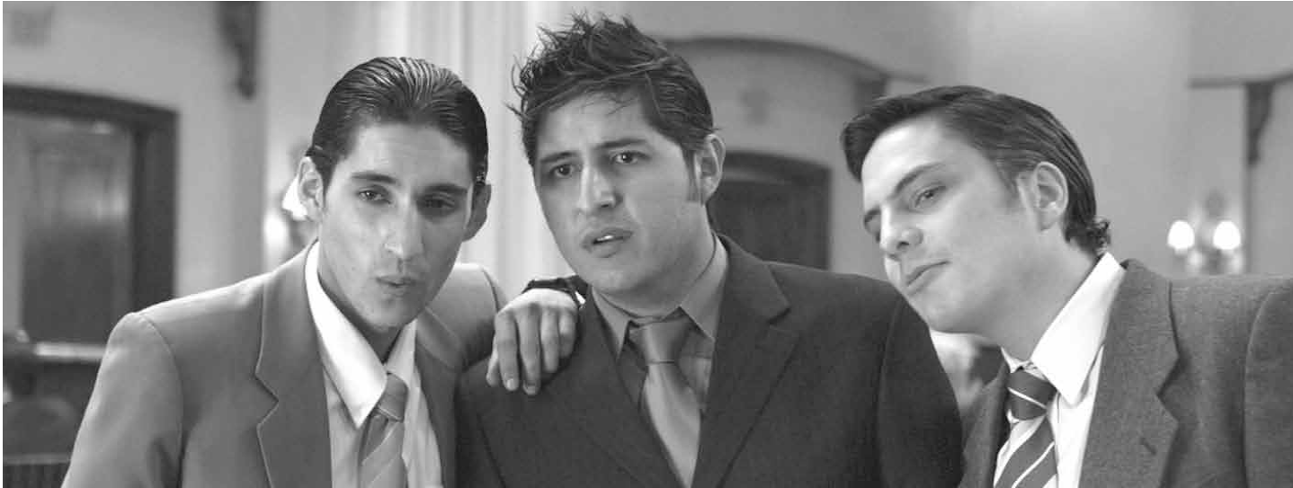
Sexismo y huevonada: fotograma de A tus espaldas.

EL DIRECTOR DE A TUS ESPALDAS , QUE SE ESTRENA EN OCHOYMEDIO Y OTRAS SALAS ESTE MES, ESCRIBE SOBRE EL PERSONAJE PRINCIPAL DE SU PELÍCULA, Y DE CÓMO SOMOS.