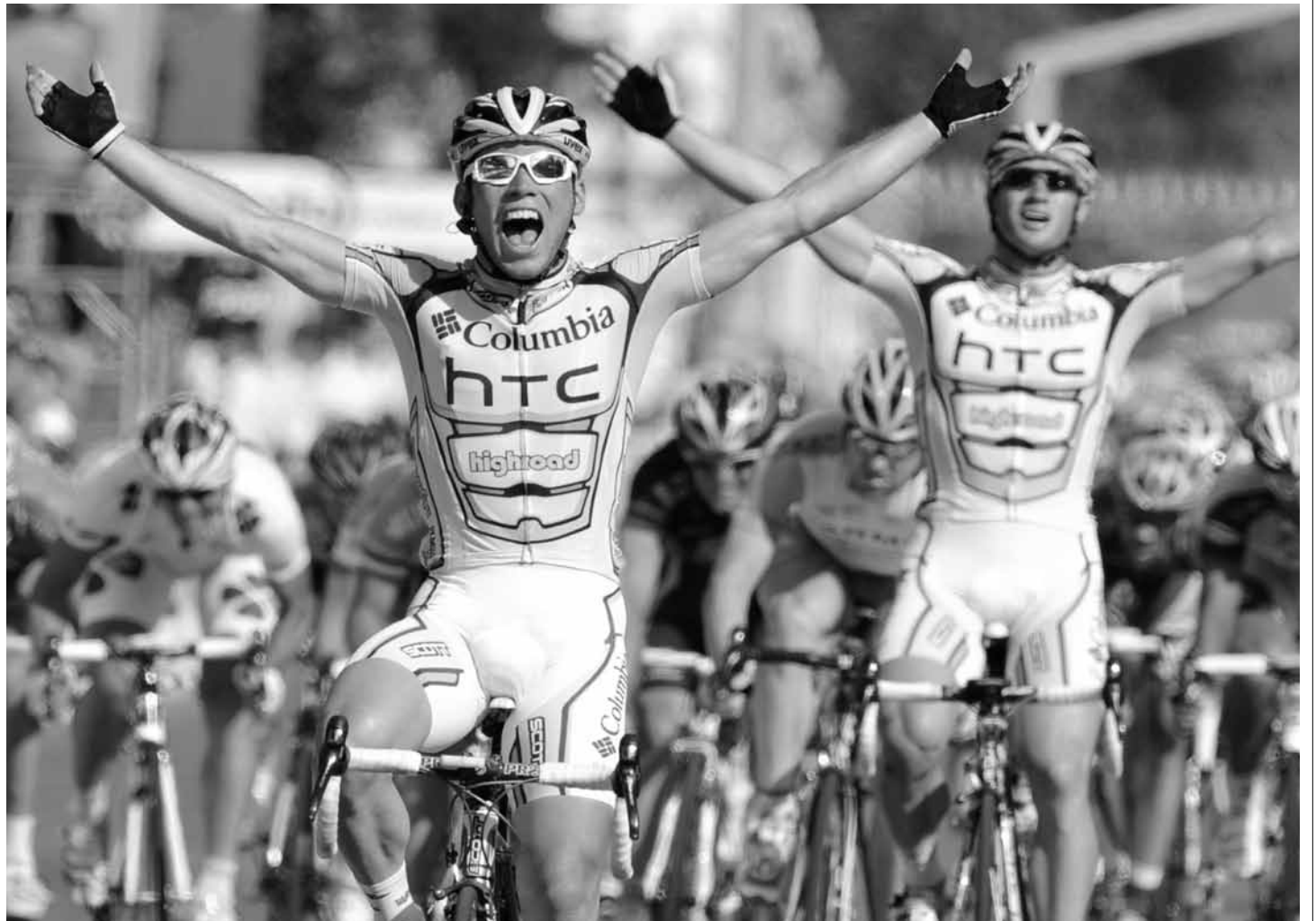
Los caballitos de acero en plena competencia. Fotograma de Chasing Legends cortesía de Jason Berry.

Entre estos aficionados, así como en el Ecuador existen todo tipo de ciclistas: los competitivos y atléticos, los que aman el aire libre y los viajes, los que pedalean para no contaminar, los que usan la bici para ir a trabajar, los que protestan contra una urbe inhumana y saturada de vehículos, etc. Tantas razones como bicicletas. Pero de entre todos estos grupos, uno que nos ha cautivado a