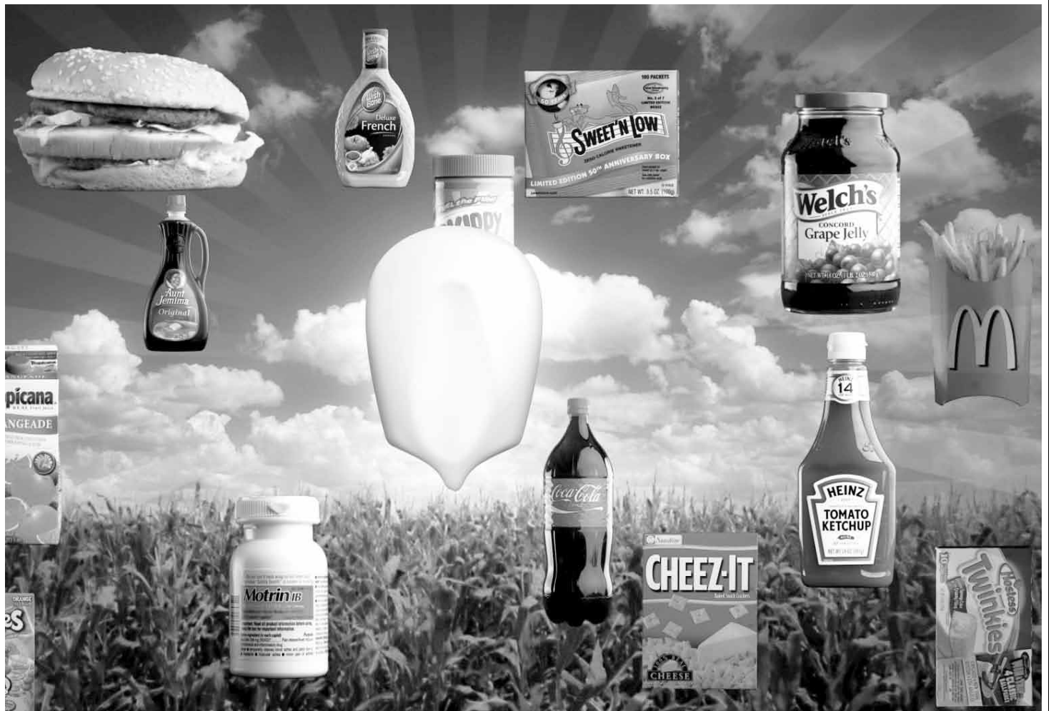
Las cosas que nos encantan son veneno. Fotograma de Food Inc.

La comida se vuelve un objeto y es intercambiable por dinero. Igualmente muchos cam-