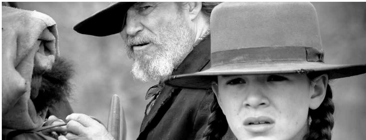
Ella lo ve todo: fotograma de True Grit de Joel y Ethan Coen.

TRUE GRIT DE LOS HERMANOS COEN ES UNA MIRADA POLÍTICA, PROFUNDA Y CONTEMPORÁNEA DE UN WESTERN CLÁSICO. ESTE MES EN CARTELETA.