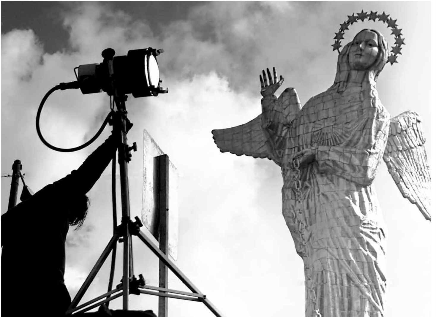
Imagen del rodaje de A tus espaldas , cortesía de Escalón Films.

El problema fundamental de la película, a un nivel de guión, está en que intenta ser muchas cosas y eso diluye la historia. Como diría mi abuela; "Ni chicha ni limonada", y como diría la máxima bíblica: "Porque eres tibio, y no frío ni caliente, te vomitaré de mi boca". A tus espaldas se ha vendido y ha intentado, de entrada,