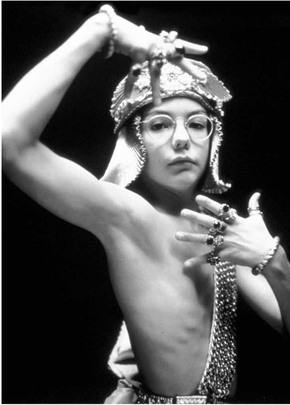
Fotograma de Wittgenstein de Jerek Jarman

WITTGENSTEIN , FILME DEL GENIAL DEREK JARMAN, ES PARTE DE LA PEQUEÑA MUESTRA QUE PRESENTAMOS DEL CINEASTA Y ARTISTA BRITÁNICO, ESTE MES.