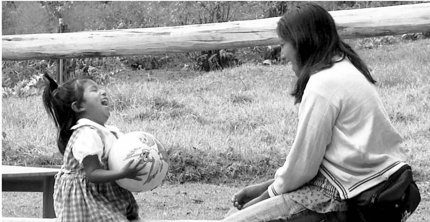
Escenas de Grandir , documental de estreno en OCHOYMEDIO.

GRANDIR , UN FILME DE ETTIENE MOINE Y BERNARD JOSSE, PRODUCIDO POR OCHOYMEDIO, SE ESTRENA EN LAS PANTALLAS DE NUESTROS CINES ESTE MES. UNA PELÍCULA QUE NOS INTRODUCE A UN LUGAR LLENO DE ESPERANZA Y CARIÑO.