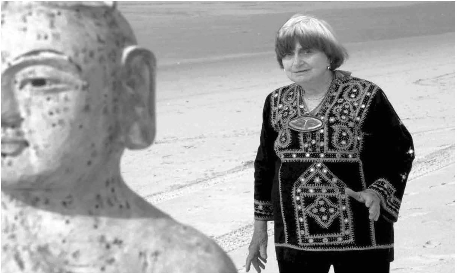
Agnes Varda en Las Plages de Agnes , en cartelera en el Festival EDOC.

Una nutrida colección de nuevos documentales ecuatorianos se estrenan. Entre ellos figu-