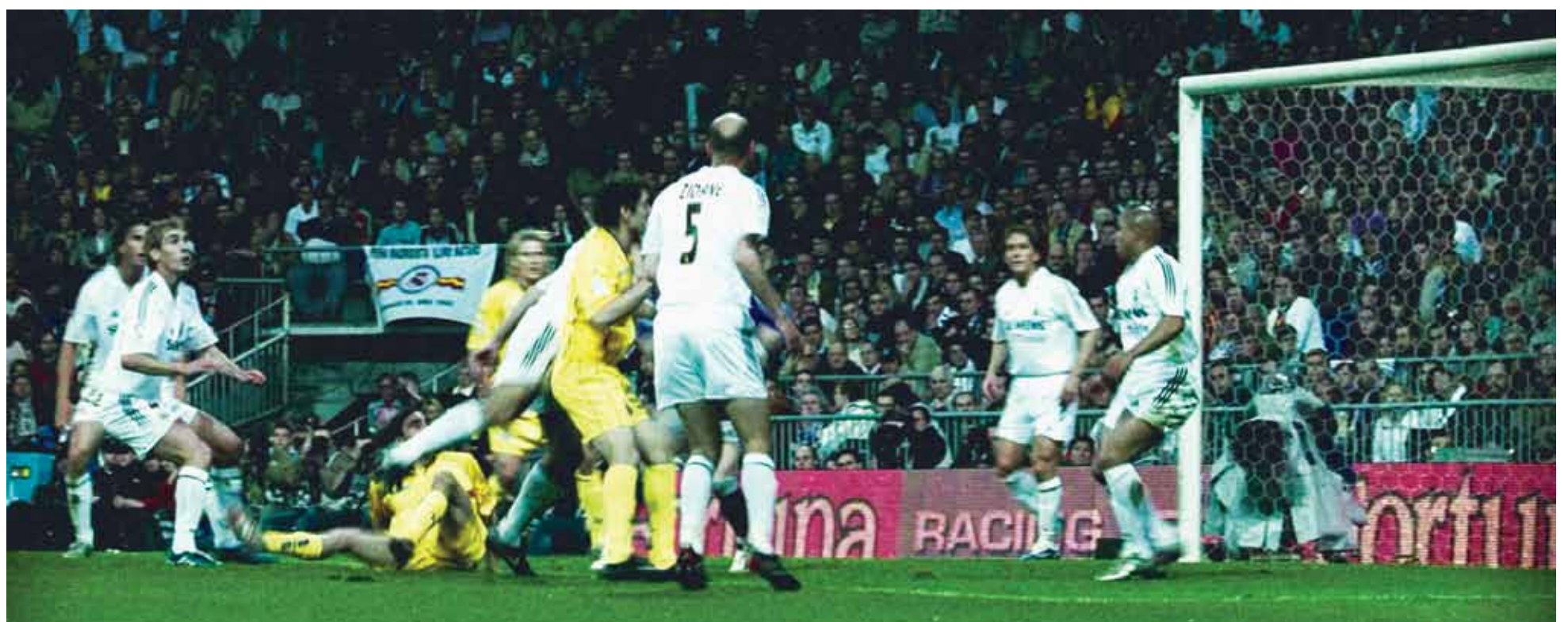
Zidane, un retrato del siglo XX. Próximamente en OCHOYMEDIO.

⊙ : Formatos digitales ⊗ : 35 mm. 🇪🇺 : Cine ecuatoriano