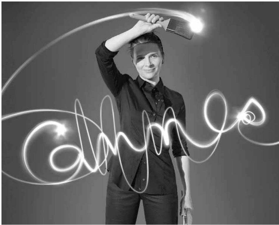
Juliette Binoche en el afiche oficial del Festival de Cannes en 2010.

CANNES SUENA A LUJURIA DE ESTRELLAS, A ALFOMBRA ROJA, A GRANDES PELÍCULAS. HOY, A PROPÓSITO DE UNA MUESTRA DE PELÍCULAS EN LAS QUE PRESENTAMOS ALGUNAS DE LAS GANADORAS DE LA CODICIADA "PALMA DE ORO", REFLEXIONAMOS SOBRE ESTE FESTIVAL.