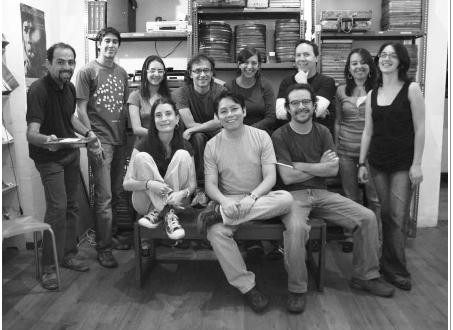
El director de los EDOC, con su equipo de colaboradores, momentos antes de recibir a sus invitados en la cena de Navidad del año pasado.