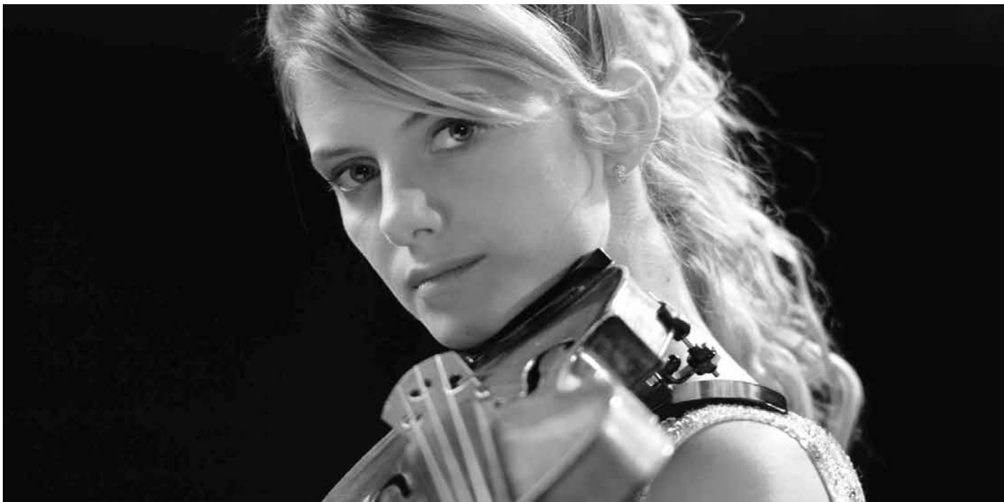
Fotograma de El gran concierto

El director rumano Radu Mihaileanu ensaya aquí de nuevo la fábula moral de las suplantaciones de identidad que tanto éxito tuvo en su cinta El tren de la vida (1998), donde un grupo de judíos se hacía pasar por oficiales nazis y en un falso ferrocarril de deportación intentaba llegar a Palestina. El tono de El gran concierto es más lúdico y desafiado que el de aquella cinta. El director de orquesta Andrei consigue reunir a sus antiguos camaradas, los convence de que una nueva oportunidad artística es aún posible, se procura en el mercado negro pasaportes e instrumentos musicales, seduce a un antiguo adversario comunista suyo, habilidoso productor artístico, y logra llegar a París acompañado de su caótica orquesta de veteranos maltrechos.