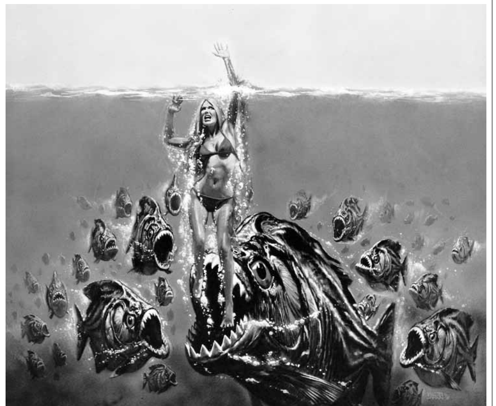
Fragmento del afiche de Piraña .

La sección "Ciencia ficción" (que bien hubiera podido llamarse "Kitsch extraterrestre") comporta los títulos: Barbarela (1968) del francés Roger Vadim, adaptación de un clásico de la historieta pop y la obra cumbre del ya citado Ed Wood, Plan 9 del espacio exterior