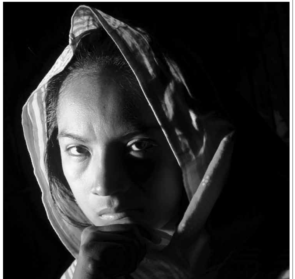
Foto del rodaje de Siguiendo las estrellas