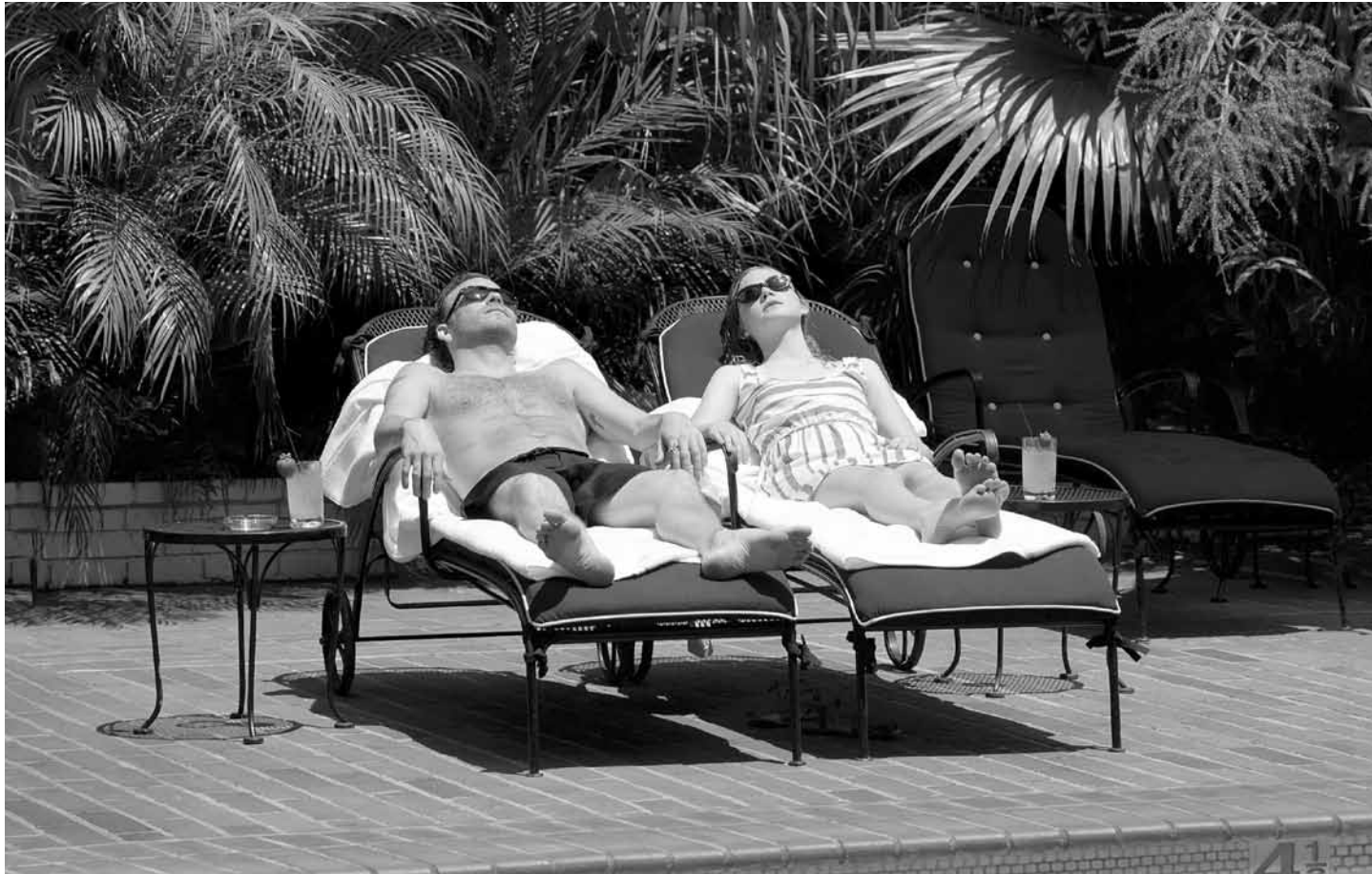
La vida cool y relajada de los famosos. Fotograma de Somewhere de Sofia Coppola

SOMEWHERE DE SOFÍA COPPOLA, EN CARTELERIA ESTE MES.