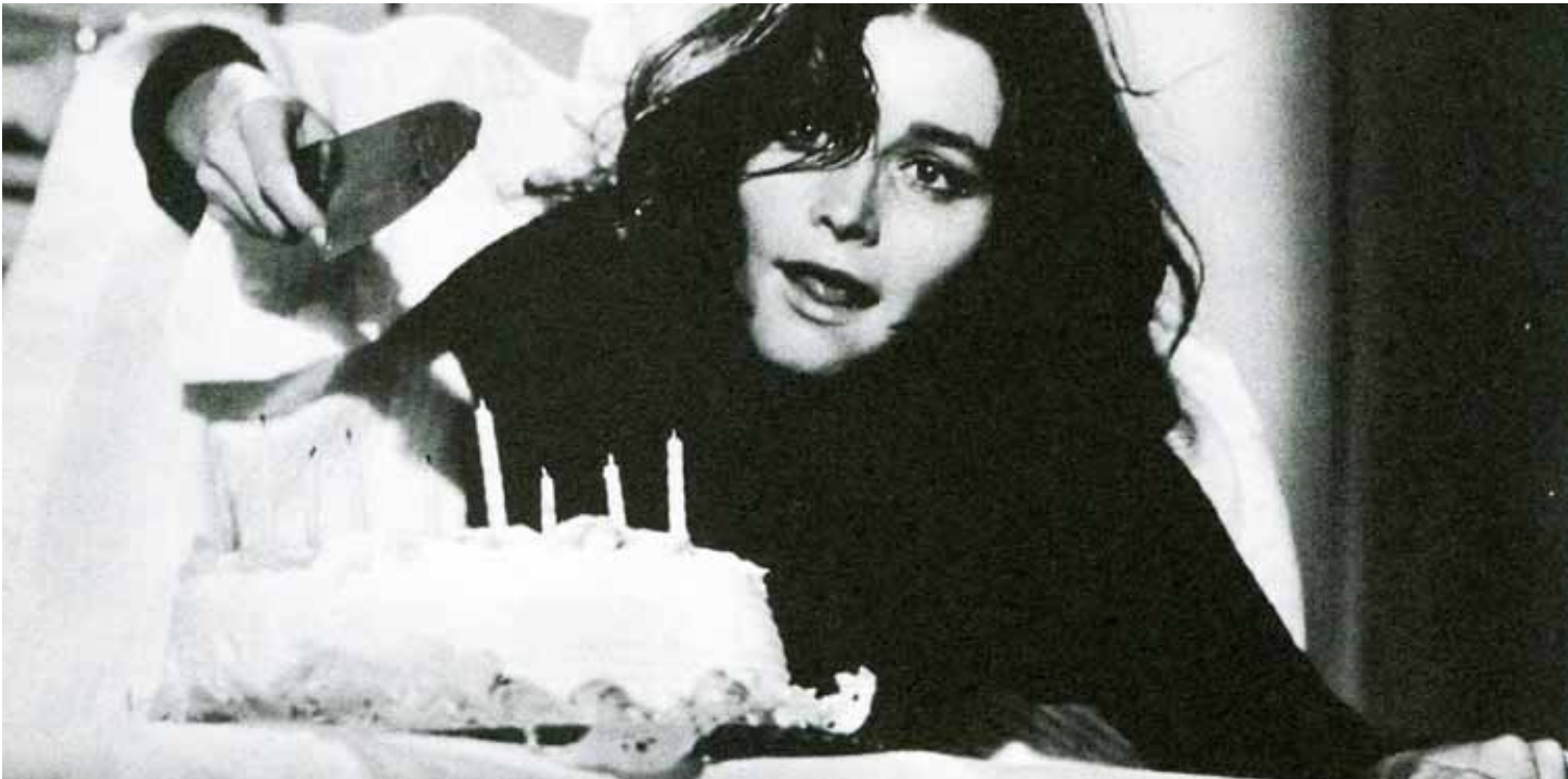
Margot Kidder en Hermanas de Brian de Palma, filme que es parte de Made in USA.

OCHOYMEDIO, JUNTO A LA EMBAJADA DE LOS ESTADOS UNIDOS PRESENTAN LA PRIMERA MUESTRA DE CINE DE CULTO. MÁS DE TREINTA PELÍCULAS COMPILADAS EN VARIAS SECCIONES SERÁN PRESENTADAS DURANTE OCTUBRE Y NOVIEMBRE. AQUÍ UNA RESEÑA BÁSICA DE LA MUESTRA.